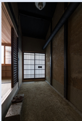
森田一弥：御所西の町家