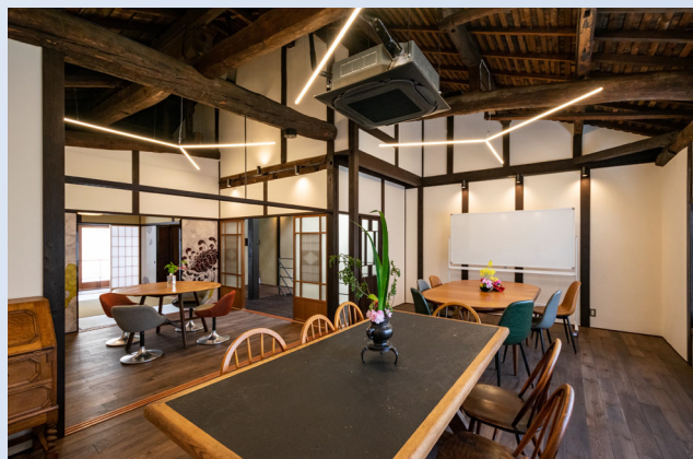
株式会社八清：ヨリアイマチャ