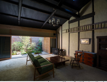
森田一弥：御所西の町家